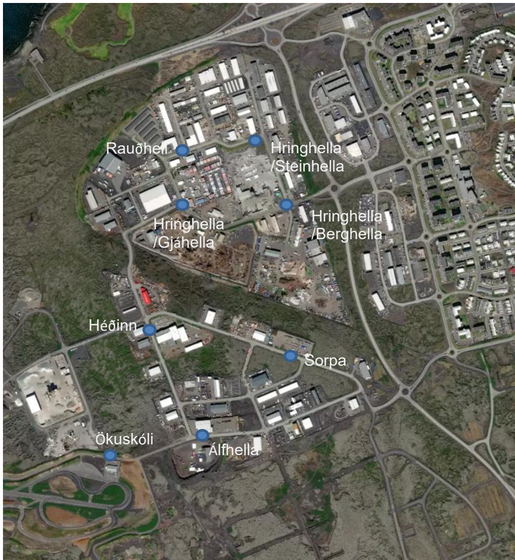
Mynd 1: Mögulegar staðsetningar stöðva